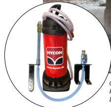
Opcional: Kit de eliminación de polvo, artículo n.º 1113286 Depósito de agua HYCON, artículo n.º 3030051

Contacte con nosotros para más información: hycon@hycon.dk / +45 96 47 52 00